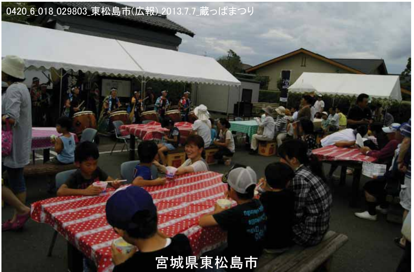
0420_6_018_029803_東松島市(広報)2013.7.7_蔵っぱまつり